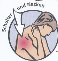
Schulter und Nacken