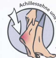
Achillessehne und Ferse